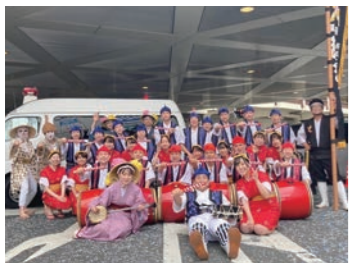
桜風エイサー琉球風車