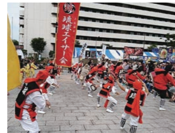
上石神井琉球エイサー会