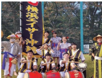
横浜エイサー沖鶴