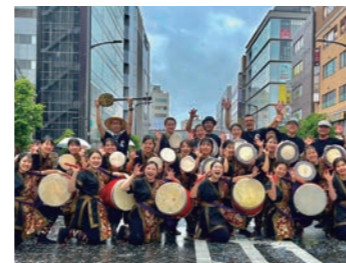
創作エイサー天晴