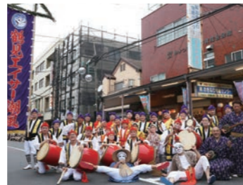
鶴見エイサー潮風