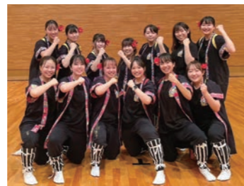
鎌倉女子大沖縄舞踊愛好会